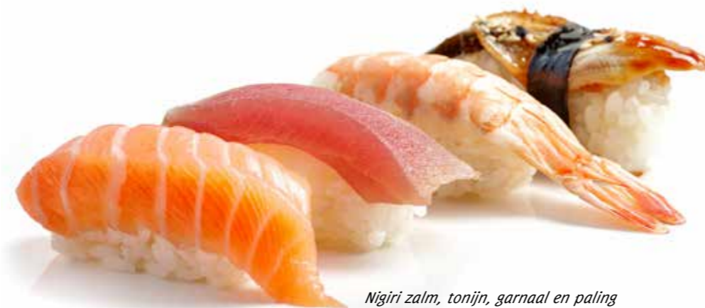
Nigiri zalm, tonijn, garnaal en paling

Wilt u ook sushi bestellen? Vraag naar onze sushi afhaalkaart!